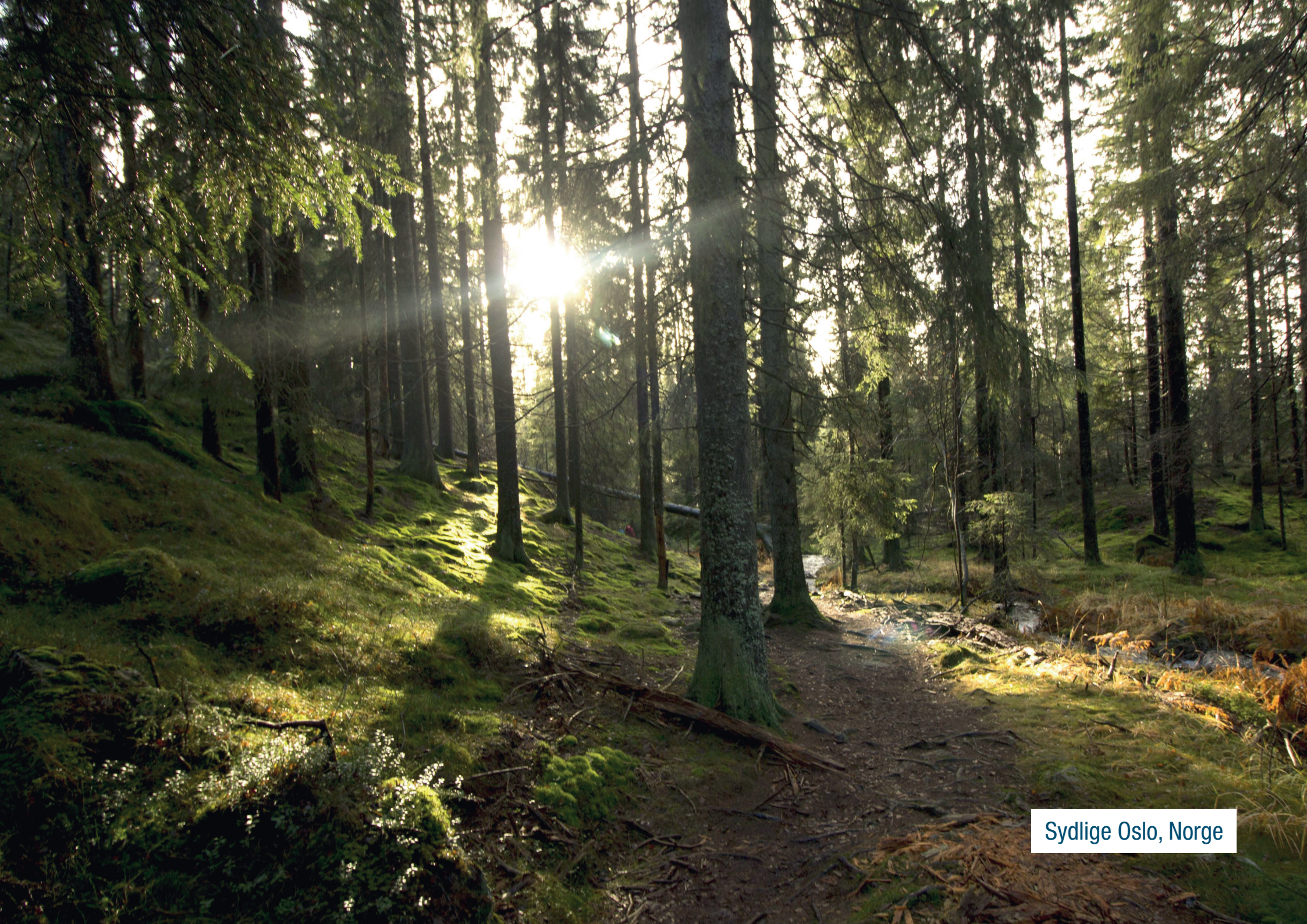
Sydlike Oslo, Norge