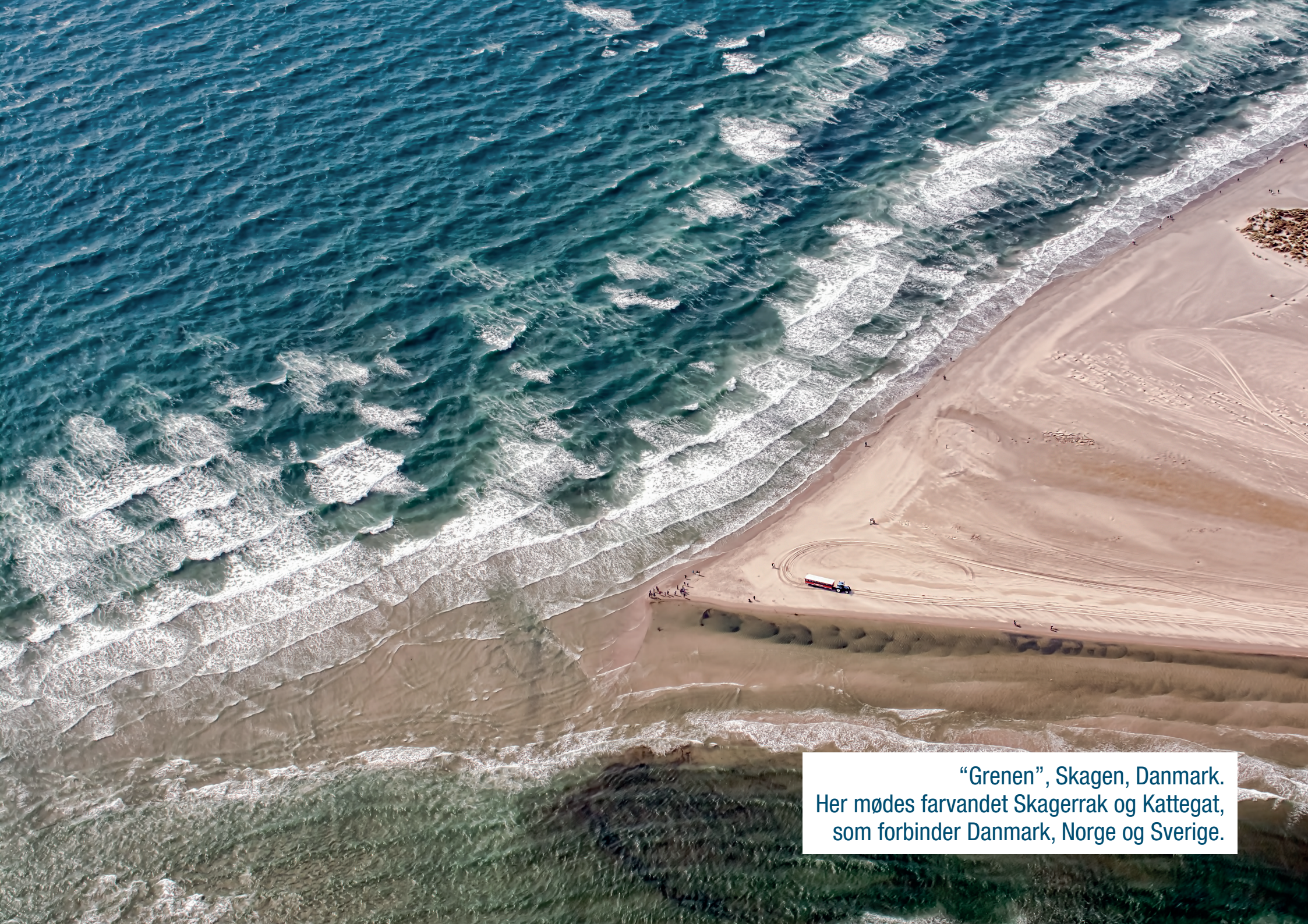
“Grenen”, Skagen, Danmark. Her mødes farvandet Skagerrak og Kattegat, som forbinder Danmark, Norge og Sverige.