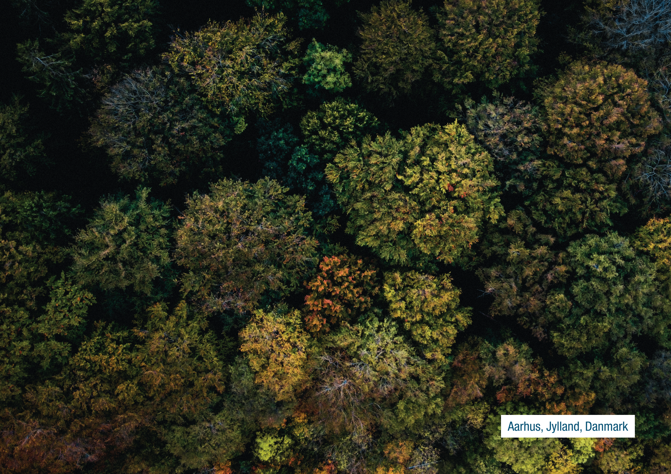
Aarhus, Jylland, Danmark