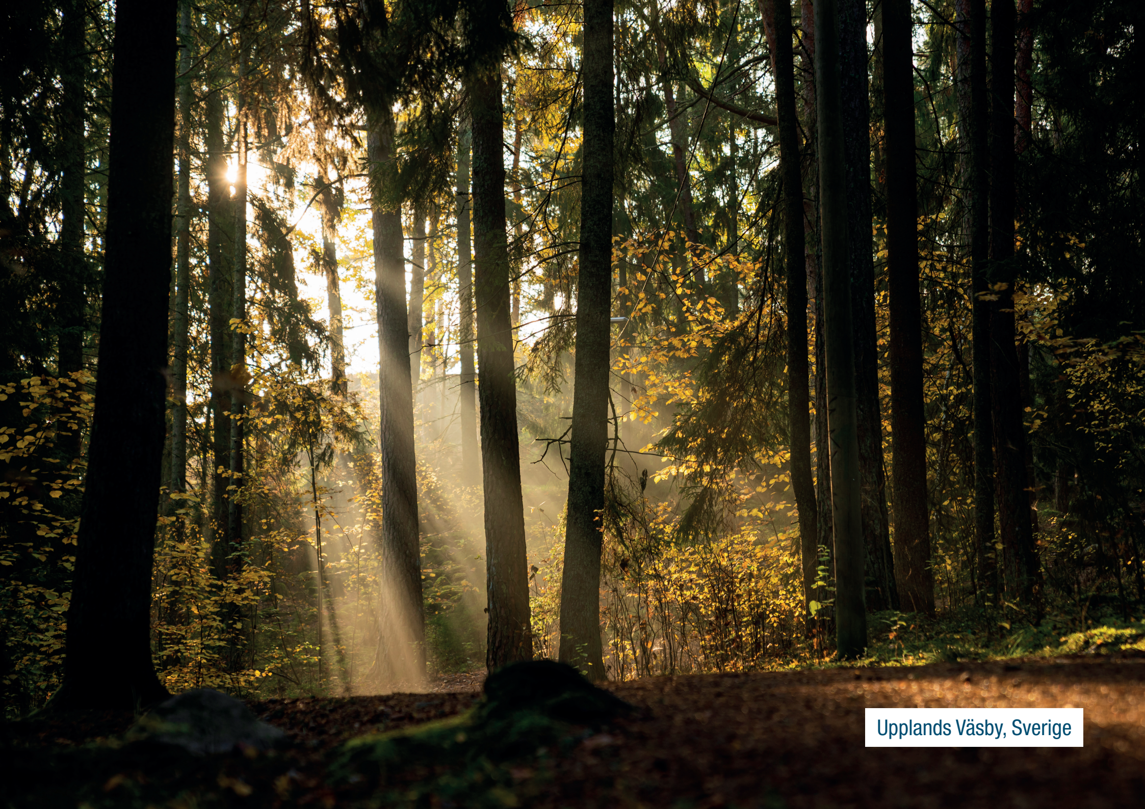
Upplands Väsby, Sverige