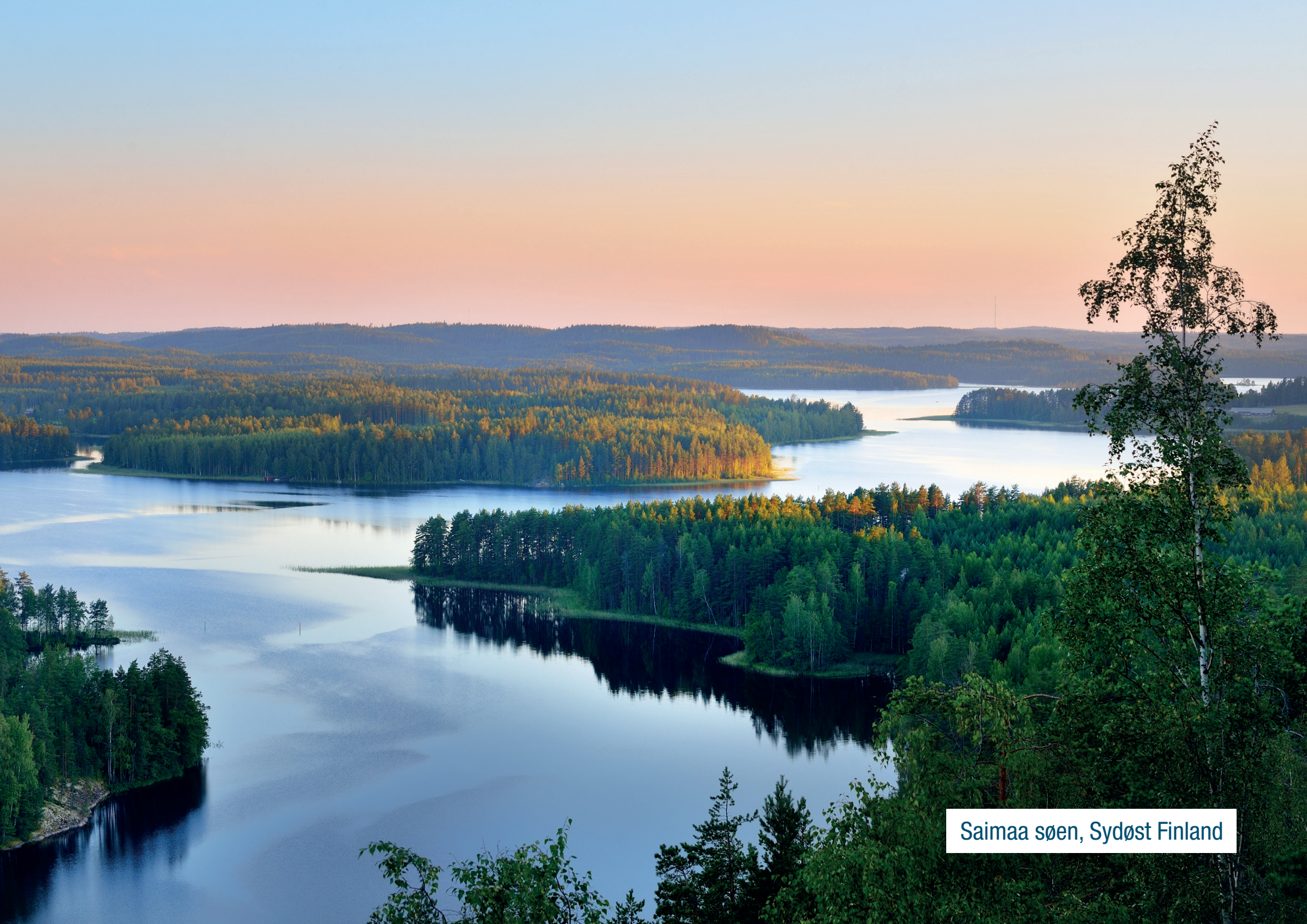
Saimaa søen, Sydøst Finland